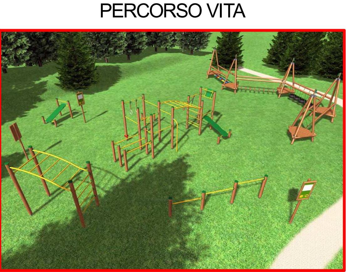
attrezzi percorso vita